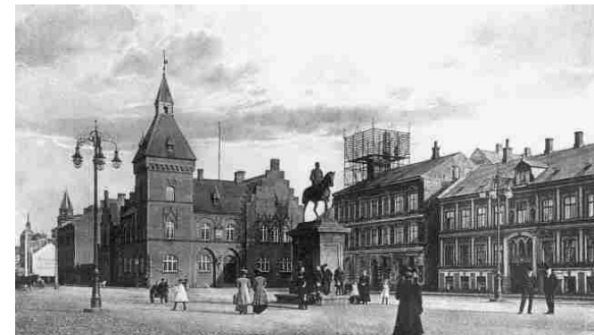
Das Bild ist aus dem Stadtgeschichtlichen Archiv entliehen und zeigt den Marktplatz um 1900.

Esbjerg Turistbureau Skolegade 33, 6700 Esbjerg www.visitesbjerg.dk