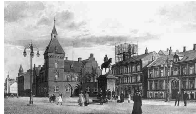
Das Bild ist aus dem Stadtgeschichtlichen Archiv entliehen und zeigt den Marktplatz um 1900.

Der Marktplatz – Torvet – ist heute das Zentrum der Stadt. Im jungen Esbjerg jedoch, das als Hafen gedacht war, lag der Markt am Stadtrand. Als er angelegt wurde, stand hier kein einziges Haus. Landvermesser H. Wilkens legte in dem ersten Straßenplan Esbjergs den Markt ganz